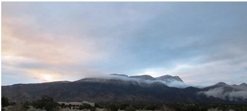
聖山 サンディア 日の出